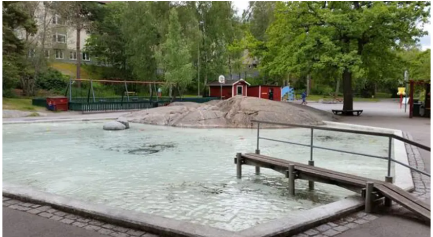
Befintlig plaskdamm i Lugnets lekplats med berghällen som har kontakt med vattnet.